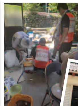
別の場所で家屋の片付けを行う学生

活動を終えて、今回の豪雨を機に災害の恐ろしさを改めて感じました。日本に住む全員が災害への意識を高め、前々から備えておけば被害をもっと抑えられると思いました。今回、災害に遭われた方々の思いが全国の災害意識を変えるものになってほしいと願います。