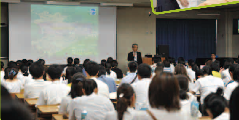
学長が1学部3学科の概要について説明しました。

4/8、新見公立短期大学としては最後となる入学式が執り行われました。短期大学の有終の美を飾ることとなる新入生95名が、新しい学びをスタートさせました。