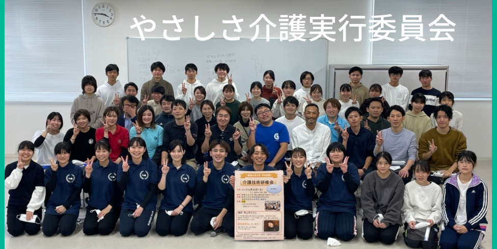
やさしさ介護実行委員会